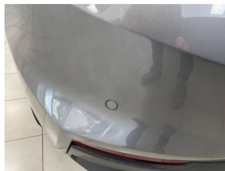
Skoda - Fabia 1.0 TSI 95 ch BVM5 Ambition