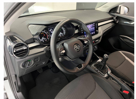
Skoda - Fabia 1.0 TSI 95 ch BVM5 Ambition