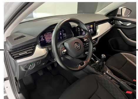
Skoda - Scala 1.0 TSI Evo 110 ch BVM6 Business