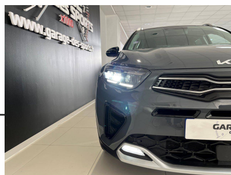
Kia - Stonic 1.0 T-GDi 120 ch MHEV DCT 7 GT Line Premium