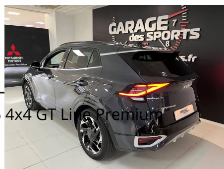
Kia - Sportage 1.6 T-GDi 265ch ISG Hybride Recharge Die BVA6 4x4 GT Line Premium