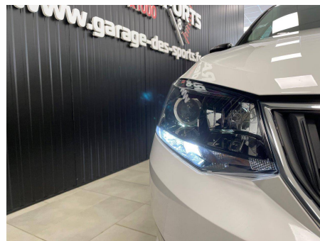
Skoda - Fabia 1.0 TSI 95 ch Greentec Drive