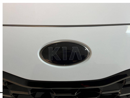
Kia - Sportage 1.6 CRDi 136ch MHEV ISG DCT7 4x2 Black Edition