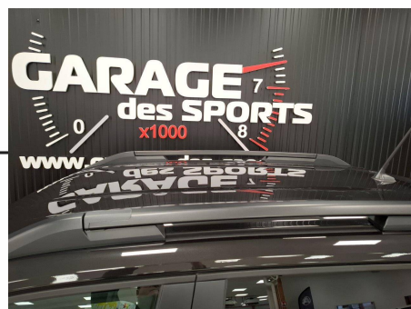
Dacia Duster TCe 130 4x4 Extreme