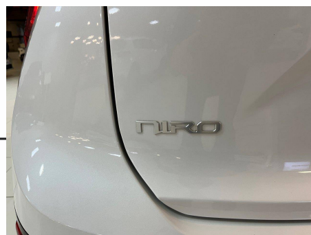
Kia - Niro 1.6 GDI 41 ch HEV DCT6 Premium