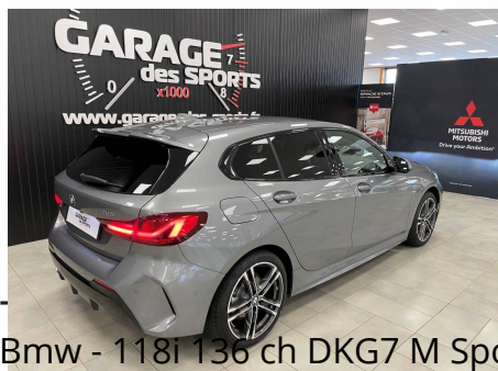
Bmw - 118i 136 ch DKG7 M Sport