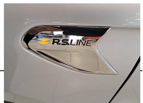
Renault - Clio TCe 140 RS Line