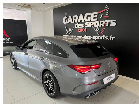
Mercedes - CLA Shooting Brake 200 7G-DCT AMG Line