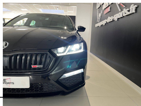
Skoda - Octavia Combi 2.0 TDI 200 ch DSG7 4x4 RS