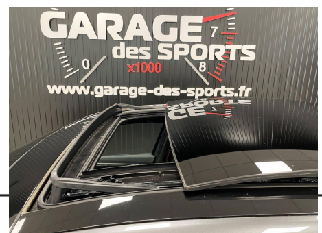
Renault - Arkana TCE 160 EDC FAP - 21B R.S. Line