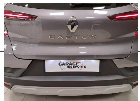
Renault - Captur Tce 100 GPL Evolution