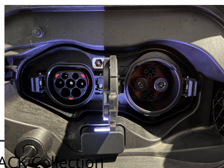
Mitsubishi - Eclipse Cross 2.4 MIVEC PHEV Twin Motor 4WD BLACK Collection