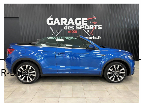
Volkswagen T-Roc Cabriolet 1.5 TSI EVO 110kW (150CV) Start/Stop DSG 7 R-Line