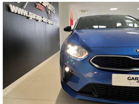
Kia - PROCEED 1.6 CRDi 136 ch ISG DCT7 GT Line