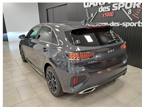
Kia - CEED 1.6 CRDi 136 ch MHEV DCT7 GT Line Premium