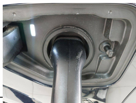
Bmw - X5 xDrive45e 394 ch BVA8 M Sport