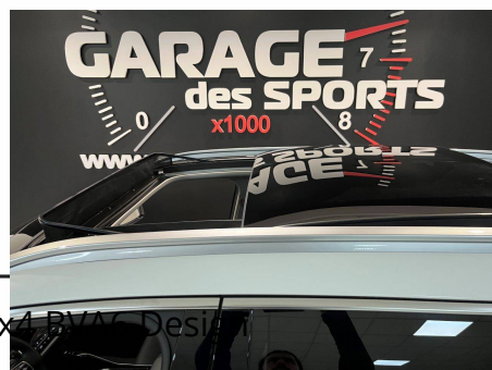
Kia - Sorento 1.6 T-GDi Hybride Rechargeable 265 ch 7places 4x4 BVA - Desi