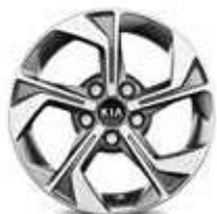
Jantes en alliage 16" (Motion & Active)