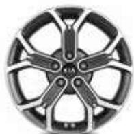
Jantes en alliage 18" (Design & Premium)