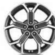
Jantes en alliage 18" (Design & Premium)