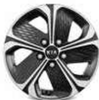
Jantes en alliage 16" (Active)