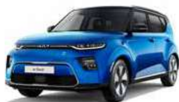
Bleu Neptune / Toit Noir Fusion (FB1)