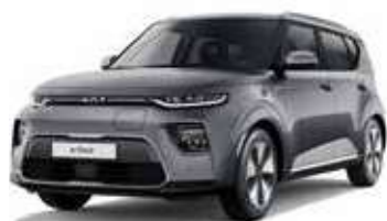
Gris Gravité (KDG)*