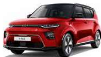
Rouge Inferno / Toit Noir Fusion (FA2)