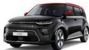
Noir Fusion / Toit Rouge Inferno (FA1)