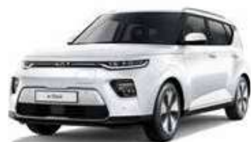
Blanc Nacré (SWP)*