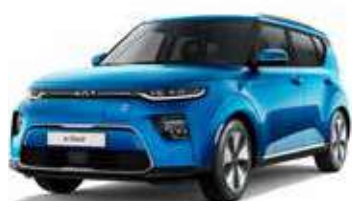
Bleu Cobalt (SRB)