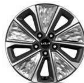
Jantes en alliage de 17" finition diamantée

* Teintes métallisée, nacrées ou bi-ton disponibles en option